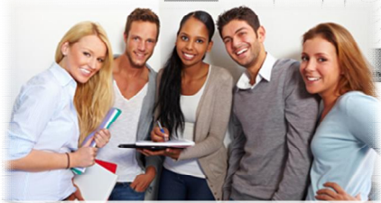
WEITERKOMMEN im HB Zürich

Wegbeschreibung: Anlieferung Standmaterial Folgende Möglichkeit steht zur Verfügung, mittels PW Ihren Stand so nahe wie möglich zu erreichen. Wir bitten Sie, auf keinen Fall mit Ihrem PW direkt in die Haupthalle des HB Zürich zu fahren. ✗ Sie parkieren auf dem Parkplatz Museumstrasse auf den Parkfeldern 18 bis 28 für max. 15 Minuten. Durch den Durchgang gelangen Sie zu Fuss in die Haupthalle vom HB Zürich. ✗ Und somit erreichen Sie einfach und schnell Ihren Stand und können umgehend mit der Einrichtung beginnen.